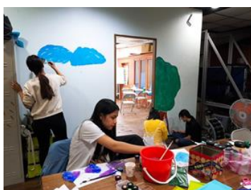
藝術創作課教室塗鴉彩繪