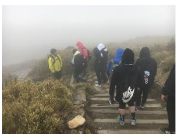
挑戰營攀登合歡山