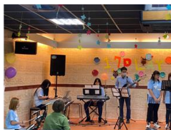
畢業典禮-樂團表演