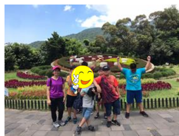
3Q 聚樂部-暑假戶外健走