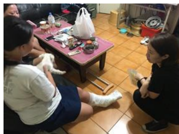
學生受傷社工到家裡關心