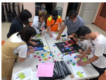
團體輔導-生活公約