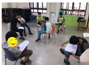
校內團體-賓果活動