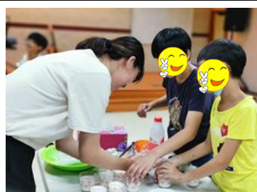
3Q 聚樂部-動手做點心