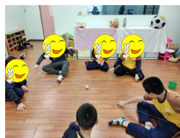
校內團體-團體合作