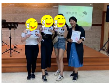
就業輔導-取得美甲證照