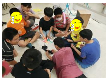
3Q 聚樂部-室內桌遊活動