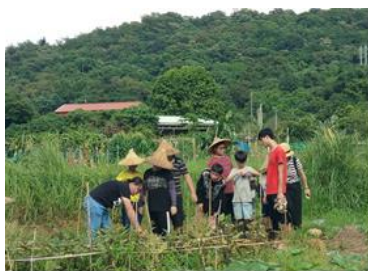
3Q 聚樂部-暑期農場活動