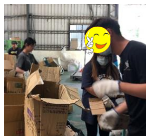
服務學習-舊鞋救命