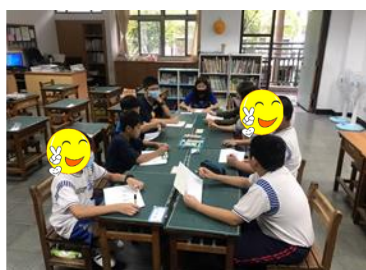
校內人際團體-相見歡