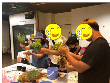
就業輔導課程-園藝治