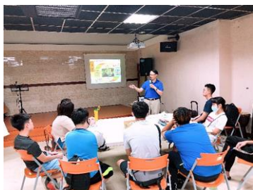
人際關係互動與技巧