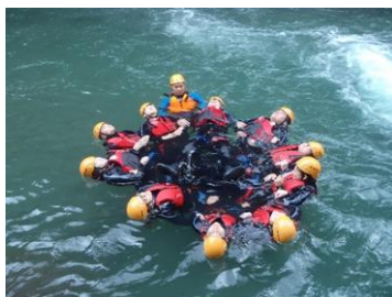
體驗教育-溯溪學員